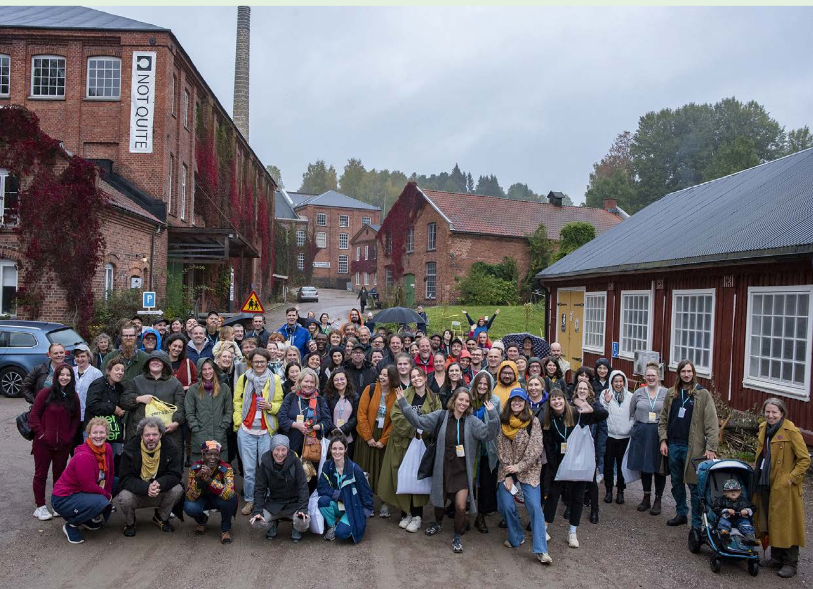
I september 2022 samlades nätverket hos Not Quite i Fengersfors.