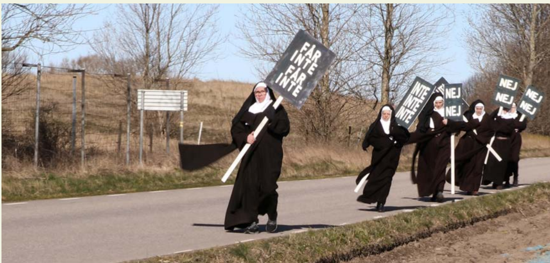
Kalle Brolin, "Jag är bergtagen", 2020.